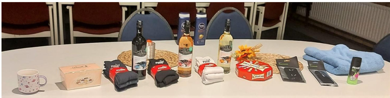
De prijzentafel staat klaar, dus spelen maar.