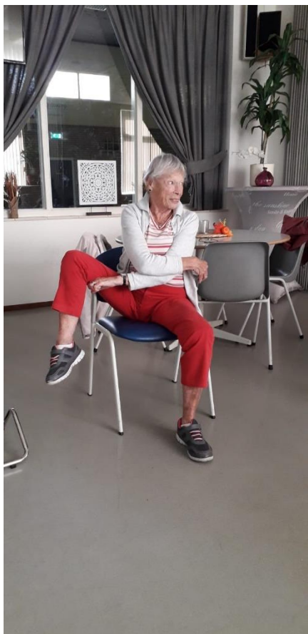
Onze 90-jarige yogi in actie

Namens onze gezellige yoga groep, wil ik jullie allemaal een hele prettige en mooie en vooral rustgevende vakantie wensen. Mocht je een keer een gratis lesje willen proberen, om te ervaren of yoga jou kan helpen bij het verbeteren van je mobiliteit, het geven van rust en je sterker kan maken, kom dan langs op donderdag middag om 16.00 uur.